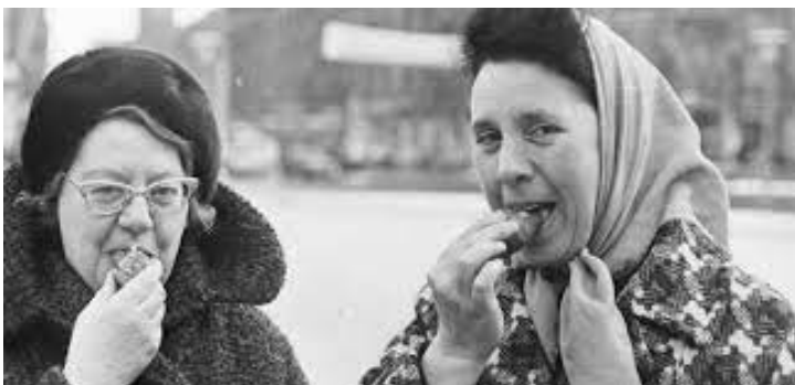
Wees maar verstandig, eet een oliebol!