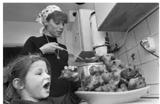
Uiteraard met poedersuiker!

Ergotherapie richt zich op het mogelijk maken van de activiteiten van het dagelijkse leven.